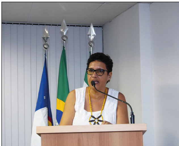
SOLEMNIDADE de posse institucional da primeira Ouvidora Externa da Defensoria Pública de Pernambuco